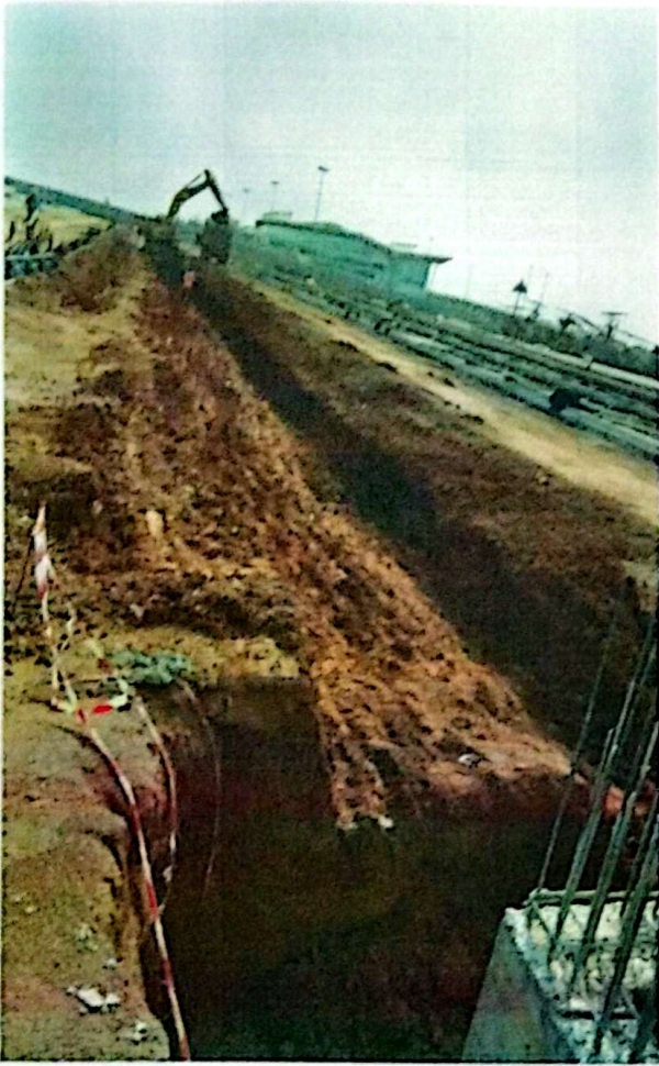
Vue du terrassement