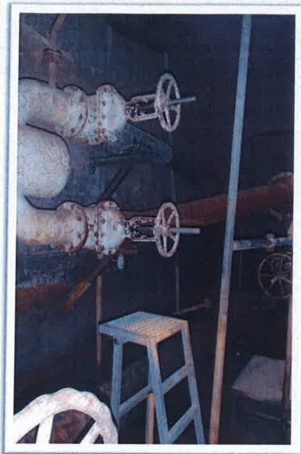
Extrait d'une chambre