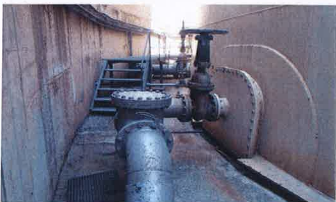
Conduite retour dépôt

DEBUT DES TRAVAUX OCTOBRE 2020 FIN DES TRAVAUX NOVEMBRE 2020