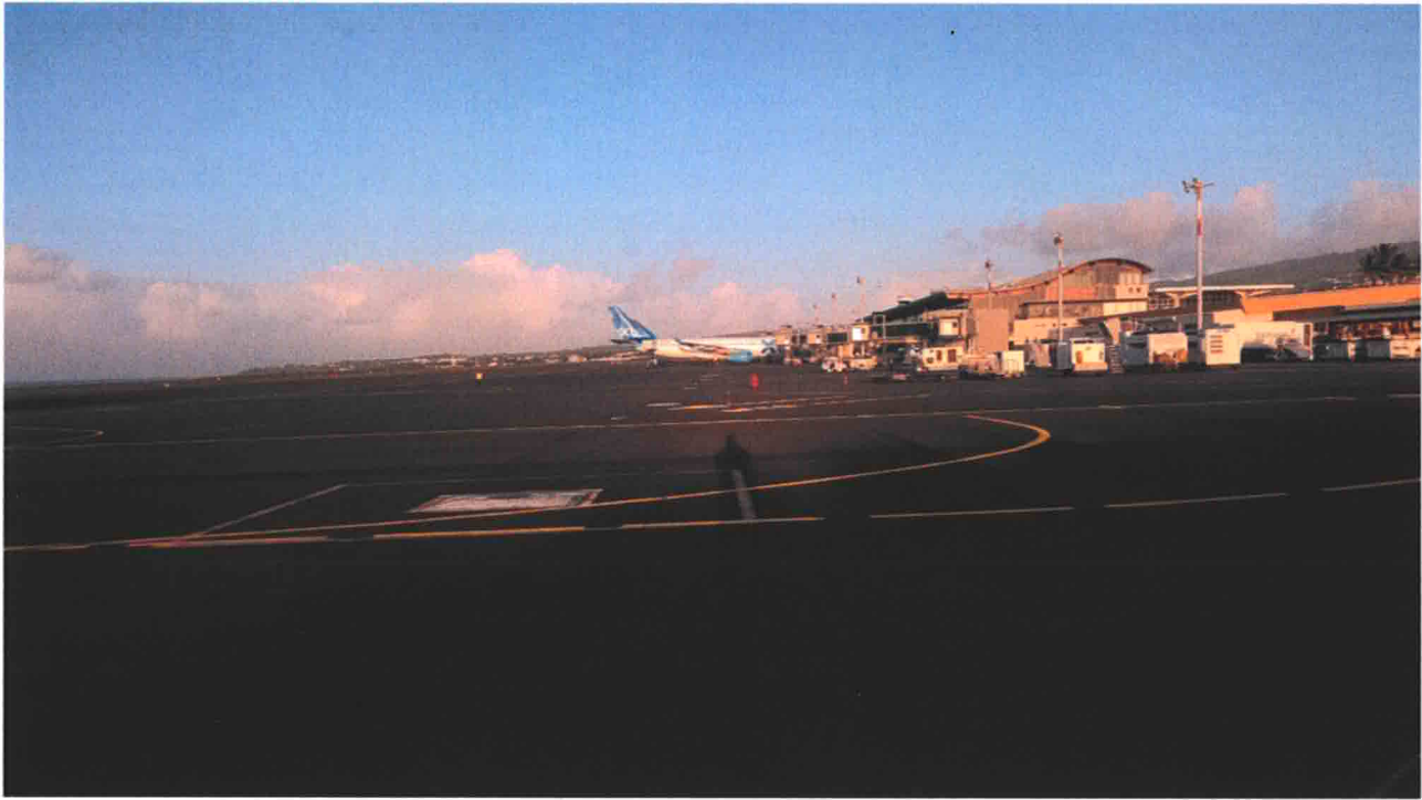
Vue de l'état initial

DEBUT DES TRAVAUX JUILLET 2018 FIN DES TRAVAUX OCTOBRE 2019