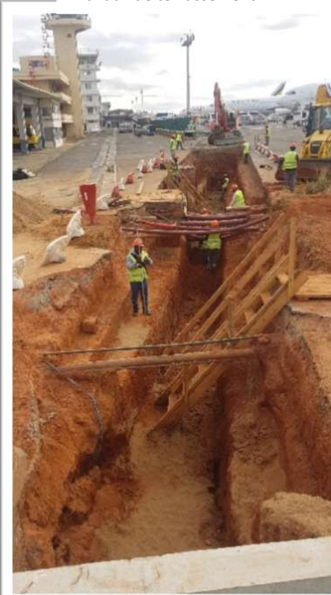
Travaux de terrassement