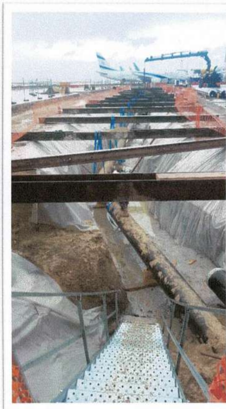
Phase remplacement d'une conduite