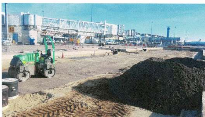
Fin des travaux de remblaiement

DEBUT DES TRAVAUX OCTOBRE 2018 FIN DES TRAVAUX MARS 2019