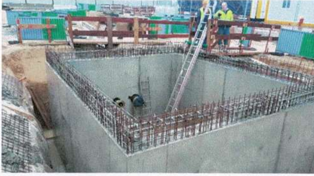
Travaux de construction de la chambre point Bas