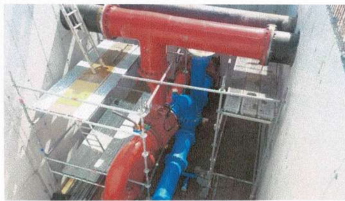
Raccordement des conduites sur le projet