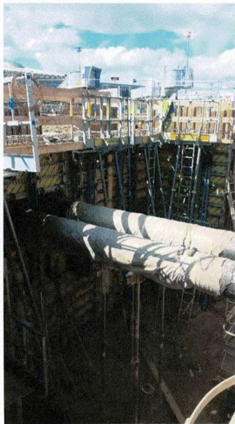
Construction de la chambre sur conduites en service