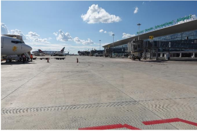
Vue des aires avions